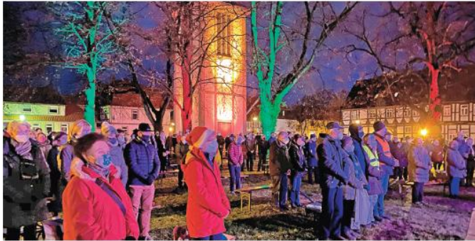
Zahlreiche Besucher kamen zum Open-Air-Gottesdienst am Heiligen Abend.

Evangelisch-lutherische Kirchengemeinde St. Vitus und St. Andreas sowie die katholische Kirchengemeinde Maria Königin feierten in Seesen eine Sternstunde unter freiem Himmel / Wenig Polizeieinsätze während der Festtage