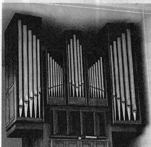
Die Orgel steht seit dem 13. Mai 1972 in Seesen.

Mehr auf unseren Webseiten: www.maria-koenigin-seesen.de