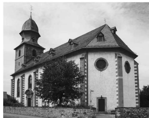
St. Cosmas und Damian-Kirche in Groß Düngen

Dekanat: Einladung von Prälat Günther nach Groß Düngen am 11.9. um 17 Uhr