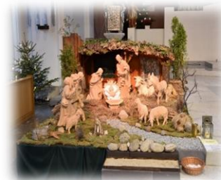
Krippenfahrt 2019 nach St. Clemens Hannover (letzte Krippenfahrt)

Wir laden herzlich ein zur Krippenfahrt am Sonntag, 08.01.2023 . Diesmal sehen wir uns die Krippe in der St. Mauritius Kirche und eine Außenkrippe in Hildesheim-Ochtersum an. Lassen Sie sich überraschen. Zum anschließenden gemütlichen Beisammensein bei Kaffee und Kuchen werden wir bewirtet im K16 CAFÉ und Begegnungsstätte in Barienrode. Der Unkostenbeitrag beträgt 20,- € pro Person (Busfahrt inkl. Kaffeetrinken). Treffen zur Abfahrt des Busses um 12:30 Uhr in Sottrum, Pfarrheim. Wir laden ganz herzlich auch die Krippenbegeisterten aus Seesen und Bockenem , Bad Gandersheim und Lamspringe sowie alle evangelischen Mitschwestern und –brüder ein.